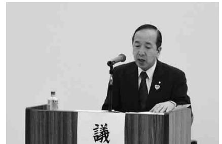
議長を務めた河野会長(玖珠町)