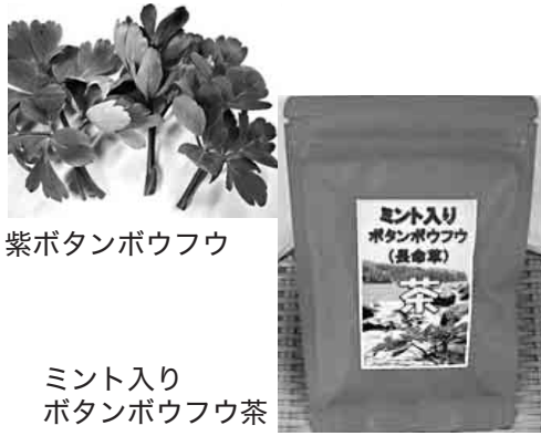
紫ボタンボウフウ

豊後高田市香々地の瀧松月堂（代表）は、平成21年に地域の特産品を開発する目的の研究会に参加。市からの協力も得られることになり、22年にはボタンボウフウ研究会として発展したことをきっかけに、香々の風土を活かした紫ボタンボウフウの栽培、特産品の開発を進めることになりました。 紫ボタンボウフウ茶の試作においては、紫ボタンボウフウの持つ独特の臭い・クセを抑え、健康茶としての成分はそのままに飲みやすくなるように工夫しています。 今後は、紫ボタンボウフウ茶の研究経験を踏まえ、さらなる加工品の開発と販路展開に取り組んでいきます。