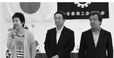
新しく選任された 左から後藤理事、大谷理事、利光副会長