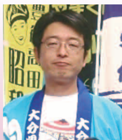
（資）木野村ヤンマー商会（姫島味の蔵）

商品のお求めは、大分市の「わくわく館」を中心に、村内土産店・香々地・国見・国東・武蔵などの道の駅で販売しています。一度食べたらくせになるかりんとうを是非ともご賞味ください。