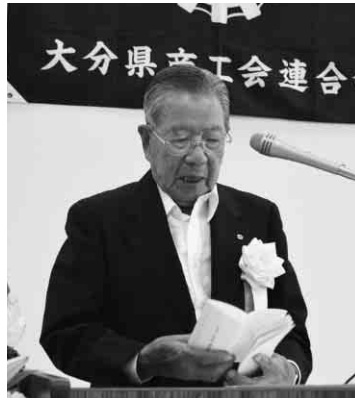
清家会長のあいさつ

感が強まり、景況感は改善しています。一方、本会会員の大部分を占める中小零細事業者にとっては、燃料や原材料価格の上昇、電気料金の値上げなどによりまだまだ景気回復の実感はなく、厳しい経済環境に変わりはありません。