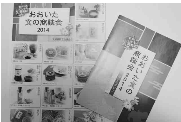
おいいた食の商談会 2014 パンフレット

大分県商工会連合会では、物産展や商談会の開催により、大分県内の逸品を一人でも多くの方に知っていただく機会を設けております。ご来場いただいたバイヤーのみならず、ご出展いただいたみなさま、誠にありがとうございました。