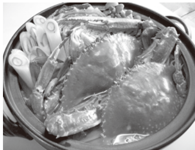
岬ガザミ鍋セット

豊後高田市香々地町には特産品の「岬ガザミ(渡り蟹の一種)」など豊富な水産資源がありますが、一般には知名度が低く、十分に評価されていません。また、「岬ガザミ」は生の状態以外で流通することが難しく、一部の市場と地元以外で買うことができない状況でした。この状況を打破するため、水産加工業経験者の協力のもと商品開発に取り組みました。当社独自の工夫により「岬ガザミ」を丸ごと茹でて、真空パックにし、冷凍状態で流通させる方法を確立し、商品化することに成功しました。こうした水産資源を使った加工品として、「岬ガザミの真空パック」、「岬ガザミ鍋セット」、「天日干し生ひじきふりかけ(えび入り・シソ入り)」、「エビ塩」等を販売しています。