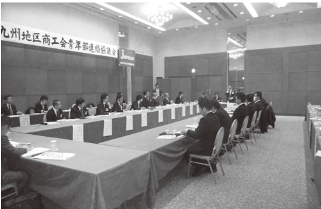
九青連連絡協議会