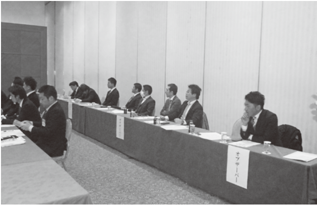
オブザーバー参加した大分県青連役員

平成28年度九州地区商工会青年部合同研修会は、9月13日(火)・14日(水)の両日に、佐賀市文化会館で開催されます。青年部の皆様のご参加をお待ちします。