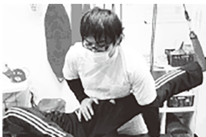
カイロプラクティック

本事業を通じて、患者様に対する治療効果を上げるだけでなく、経営面でも実費診療に取り組む体制作りを進めるきっかけとなりました。WEBページは、見やすい内容にリニューアルされ、今後も当院の広告塔となることが期待されます。