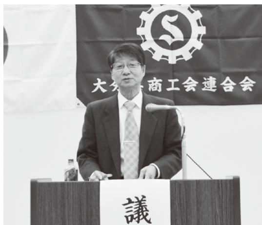
議長を務めた多田会長（佐伯市あまべ商工会）