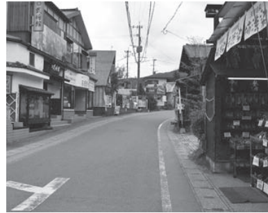
地震直後の湯の坪街道