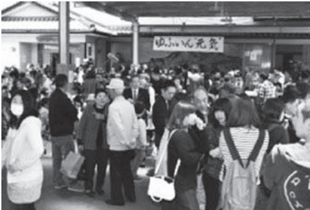
地域を活気づけるイベント ゆふいん“元氣”の様子

復興・再建への道のりは長く、険しいものになると思いますが、皆様方と手と手を携えて全力で取り組んでいきますので、これからも温かいご支援とご協力をよろしく願っています。