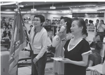
表彰式：団体の部優勝の県央地区