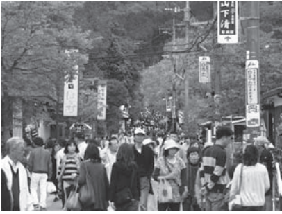
地震前の湯の坪街道

こうした中、由布市商工会では、この地震被害からの教訓を受け、災害対策委員会を設置するとともに、「災害対策マニュアル」を作成し、災害・非常時の対応に取り組みました。また、震災関連の金融相談窓口を設置し、日本政策金融公庫大分支店と連携を図り、一日公庫（2回）を開催して被害にあつた会員事業所の資金相談に