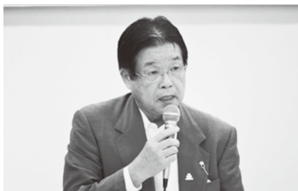
挨拶をする森竹会長

業者の支援、震災復興などに関する懇談が行われ、県と商工会の連携を深めることができました。