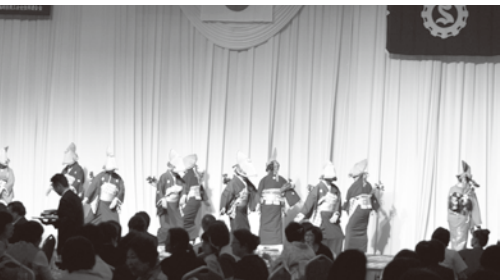
アトラクション（玖珠町商工会女性部）

7月13日～14日、「九州ブロック商工会女性部交流研修会」がヒルトン福岡シーホークで開催され、大分県から93名が参加しました。