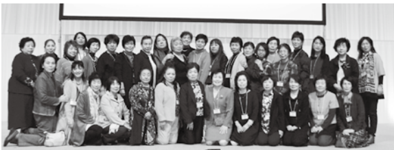
全国大会女性部の方々

また、「関ヶ原町歴史民俗資料館」の視察では、地元の関ヶ原町商工会女性部が「おもてなし交流事業」の一環としてお出迎え、案内をしてくださるなど、充実した県外研修を実施出来ました。