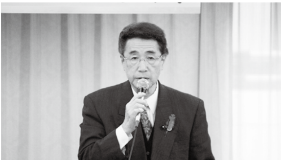
衛藤商工対策調査会長挨拶の様子