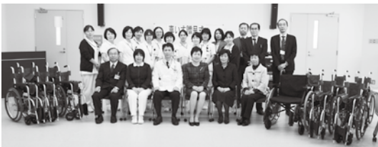
11台の車いすを贈りました