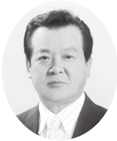
旭日双光章 利光直人