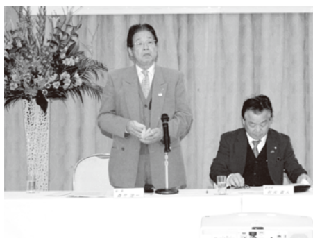
理事会で挨拶する森竹会長