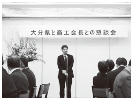
懇談会 県神崎部長の挨拶