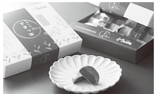
佐伯・因尾茶スイーツ「おおいた すきっ茶」