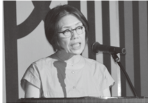
心のこもったプレゼンをする発表者

プレゼンテーション発表会では、1次、2次審査を通過した11団体の代表者が、各地域の特色ある資源を活かしたプランを発表しました。各団体の気持ちのこもった発表に、参加者は熱心に聞き入っていました。今回受賞した6団体は地方創生プランコンテスト事業に採択され、事業費補助（上限50万・補助率9/10）を活用してプランの実施に取り組みます。