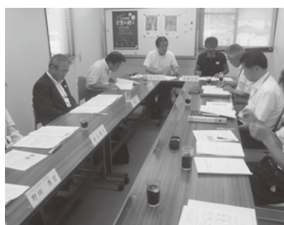
懇談会風景（九州アルプス商工会）

本巡回は、商工会における重点事業の推進、商工会と商工連の連携強化、商工会が抱える課題解決等を目的として開催しています。今年度は、主に新任会長の商工会を中心5商工会（九州アルプス商工会、野津町商工会、西国東商工会、国東市商工会、日出