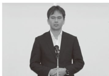
高濱商工労働部長による挨拶

ターは、黒字にもかかわらず後継者がいないことより廃業に追い込まれた企業の事例や日本の企業の3社に1社が廃業の危機を迎える2025年問題等について述べられました。また、プッシュ型事業承継支援高度化事業としての支援策や事業承継診断等について、承継新聞やチラシを使い説明されました。