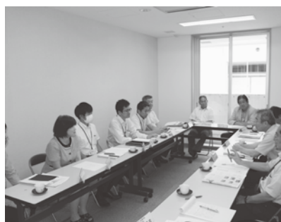
懇談会風景（国東市商工会）

町商工会）を巡回しました。今回は、特に市町村中小企業活性化条例の制定に向けた取組みや効果的な活用、経営発達支援計画の取組みや2020年商工会女性部全国大会開催に向けた共済事業の推進、また組織基盤強化への取組み等についても意見交換を行いました。商工会からは、事業の取組状況や商工連への要望等についても多くの意見を伺うことができ、今後の事業運営に向け、大変有意義な懇談会となりました。