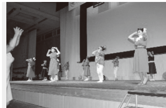
アトラクション（由布市）