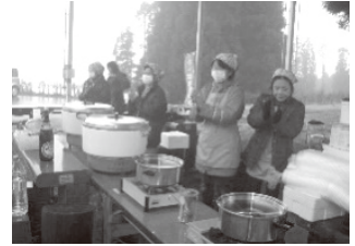
野津原町商工会女性部

「芯から温まる」という言葉をも らえると寒さも飛んでいきます。 今年度は、地方創生プランコン テスト事業が採択され、試作中の 野津原特産の柿を使用したソフト クリームを商品化し、商工会女性 部として地域を盛り上げていきま す。