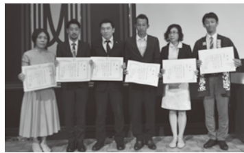
受賞した6団体の代表者