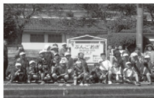
花植え後の集合写真

継続して、地域の美化作業及び地域のアピールになるように、女性部員一同取り組みます。