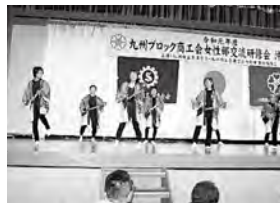
アトラクション（九重町商工会）

また、地域や社会に貢献しながら地域活性化に大きく寄与している女性部を称える「全女性連まち（地域）づくり顕彰」が、九重町商工会女性部に授与されました。