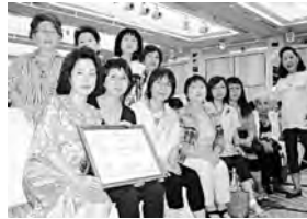
まちづくり顕彰授与（九重町商工会）