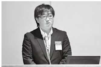
発表する日田地区商工会青年部