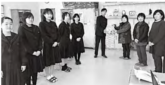
大野中学校の皆さんへキャップを寄贈する様子

地道な活動ではありませんが、今後も大野中学校生徒の皆さんと一緒に支援の一助になれるように、出来る限りこの事業を継続して行きたいと思えます。