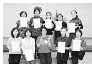
養成講座認定された女性部員