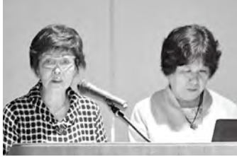
発表する豊後大野市商工会女性部

支援事業に採択され、事業費補助(上限50万・補助率10/10)を活用してプランの実施に取り組みます。