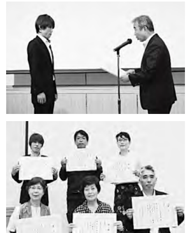
受賞された団体の皆さん

九州アルプス商工会青年部(直入支所)「思わず行きたくなるお店に!QRコード動画付直入リーフレットマップで観光客や直入を知らない人たちに全てを楽しんでもらおう!!」惜しくも受賞を逃した団体も、フォローアップ事業(補助額10万・補助率10/10)に採択されます。