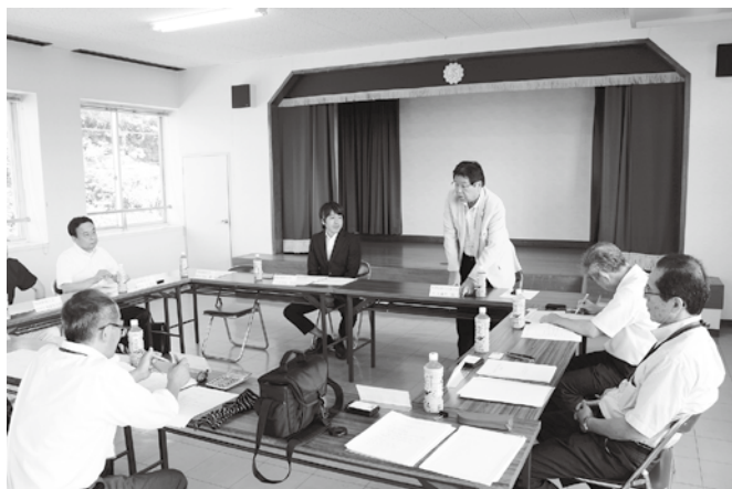
懇談会風景（西国東）

商工会からは、事業の取組状況や商工連への要望等についても多くの意見を伺うことができ、今後の事業運営に向け、大変有意義な懇談会となりました。