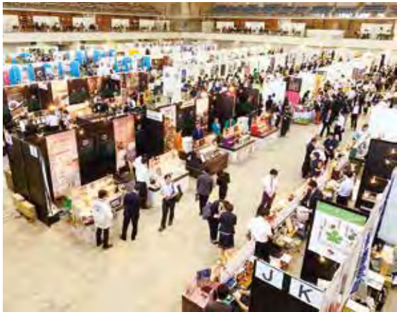
黒で統一された大分ブース