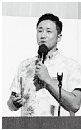
商人ネットワークPRの様子

また、自社商品等のPR及びビジネスチャンスの創造を目的として開催された九州商人ネットワークでは、大分県から(株)国東七（国東市商工会青年部）が参加し、プ