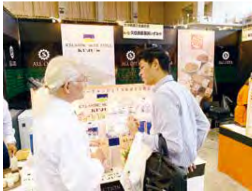
商談に力が入る出展者

10月9日～10日の2日間、福岡国際センターで開催された「Food EXPO Kyushu 2019 (国内外食品商談会)」において、大分県内の魅力ある商品を国内外へ広めていくことを目的に、公募で集まった県内の19社が、統一感のあるブースで出展しました。 参加者は商談会までに計3回の研修を受講し、商品開発や商談会出展ノウハウなどを習得した上で商談会に臨みました。その成果もあり、来場バイヤーとの商談もスムーズに進んだようでした。また、国外バイヤーからの商談で、自社商品の新たな展開も見えてきたようです。初めての参加者は、「初めての出展で戸惑う所もあったがバイヤーとの商談方法を理解できた。今後の販路拡大の参考になった」と話していました。 商談会には各出展者の担当経営指導員等33名も同行して、出展者のサポートを行いました。ある若手経営指導員は、「展示商談会という販路開拓の最前線に出展に携わることが出来、とても貴重な経験ができた。今後の支援業務に活かしたい」と話していました。