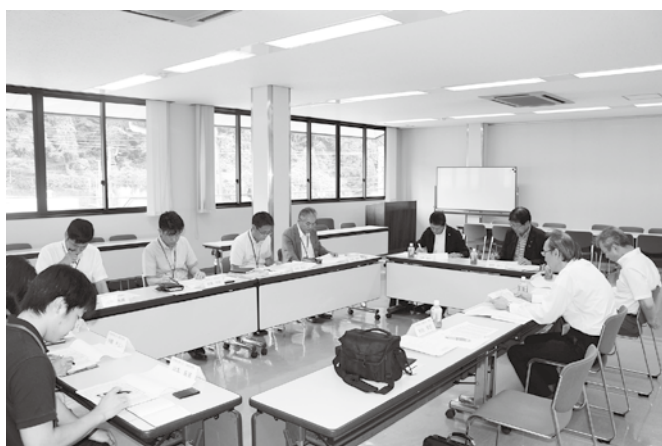
懇談会風景（日田地区）