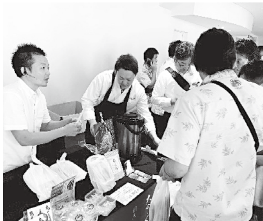
にぎわう商人ブース

プレゼンPRでは、国東半島が全国で唯一の七島蘭の産地であることや、七島蘭を使った製品について素材の特長や歴史を交えながら説明をしました。また、同じく(株)国東七の取扱商品であり、国東市商工会青年部員が製造している「鬼おんちつぶす」と「だしパック」についてもPRしました。「鬼おんちつぶす」は国東市商工会青年部のまちづくり事業「地域ソーセイプロジェクト」の一環で大分県立国東高等学校双国校の生徒とともに開発し、国東ゴゴク堂が製造している商品です。割烹大喜が製造する「だしパック」は大分県産シイタケを使用し、国産・大分県産素材にこだわった、化学調味料・保存料不使用の無添加です。どの商品も開発の背景や品質の高さが参加者の興味を引き、ブースは賑わいを見せていました。