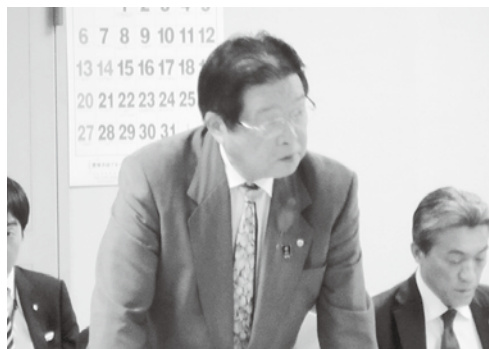
森竹会長あいさつ