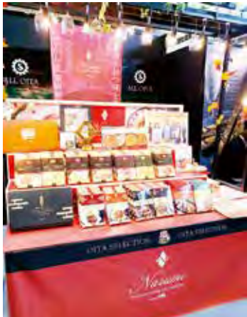
個社の個性が光るブース