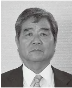
【大分県功労者表彰】