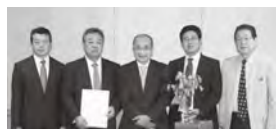
知事を囲む表敬者