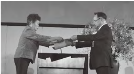
「まち（地域）づくり顕彰」（由布市商工会女性部）

令和2年度の全国大会（大分大会）の開催に向けて、多くの部員が参加し、各役割分担や大会運営の様子を確認し、今後の準備に役立てる研修となりました。