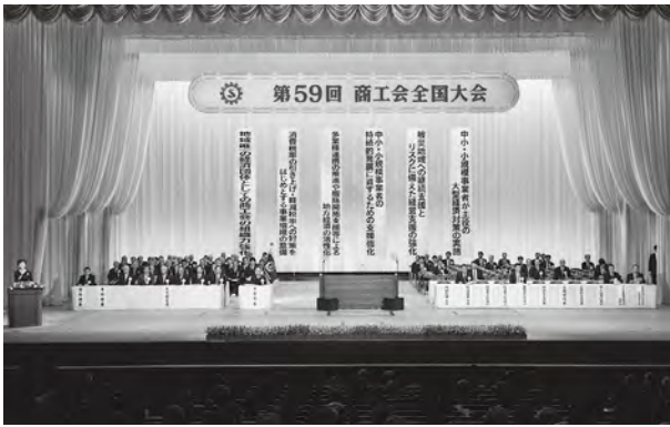
第59回商工会全国大会

商工会は、地域の要として力強く存在感を発揮し、中小・小規模事業者の持続的発展と地域経済の活性化をリードしていくために、組織の向かうべき方向性を共有し、会員同士・商工会同士のつながりをより強固なものにしていきます。こうしたことから、大会では次の6項目について決議がなされました。