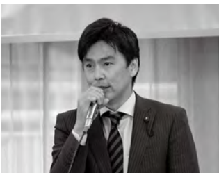
大友商工対策調査会長の挨拶の様子