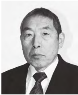
【大分県功労者表彰】