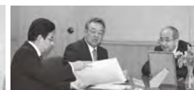
知事に事業内容を説明する西野社長