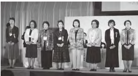
部員増強運動商工会女性部の部（九重町商工会女性部）