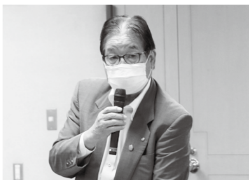
森竹会長あいさつ

森竹会長は、この中から、新型コロナウイルス感染症に係る支援体制の整備・強化、ウイズコロナ及びアフターコロナにおける県内への誘客促進のための支援策の拡充など重要性の高い項目について説明し、商工会が会員事業所の繁栄と地域経済の発展のために、経済団体として機能を十分発揮できるよう協力を求めるとともに、商工会に対するさらなる支援を要望しました。