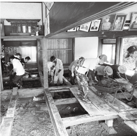
民家の汚泥を撤去する青年部員

また、日田地区商工会女性部は、被災者に対するお弁当の炊き出し支援（300食程度）を4回実施しました。今後の復興・再建に向けて、県青連・県女性連としてできる限りの支援を行っていきます。