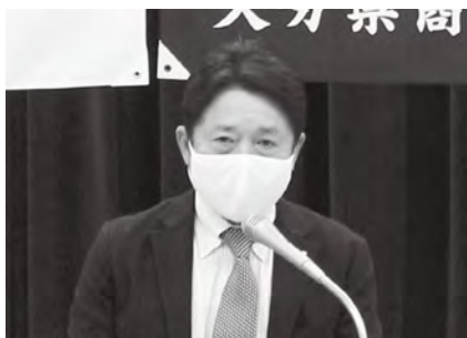
議長を務めた矢野会長（日田地区）