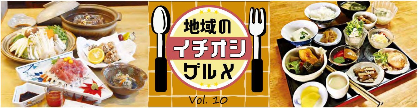
スッポン料理フルコース 6,800円(税込)