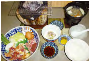
地鶏コース 2,850円(税込)