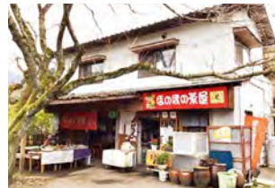
ほのぼの定食 500円(税込)