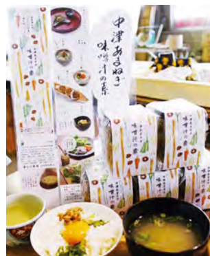
新商品「中津あまねぎ 味噌汁の素」 400円(税込)