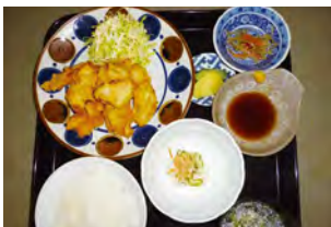
とり天定食 1,200円(税込)