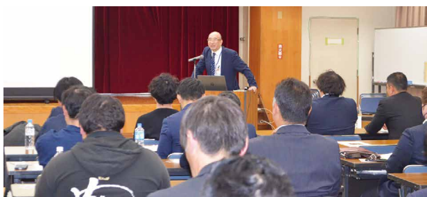
熱心にセミナーを受講する参加者