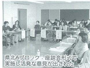
県北Aブロック：座談会形式で実施し活発な意見が出された