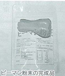
ピーマン粉末の完成品

百萬元の補助金に目がくらみ、皆で研修旅行に！と手を挙げ決定したものの後が大変。直川の特産品開発ということで地域の各種女性グループの人達に声をかけ協議会設立テーマが「B級品野菜を使つての特産品開発」の地域で生産している原材料の調査をし、ピーマンに決定。その後会議の度にピーマンを使ったケーキ・かりんとう・豆腐・うどん等試作品を持ち寄り討議を重ね、最終的に保存が利き用途も広がるのではとピーマンの粉末化に決定。地域の皆さんと協力し合い補助金を有効利用し1つの物を作り上げた喜びと、この事業に取り組み以前にも増して部員の結束が強まり、実施して本当に良かったと実感しています。