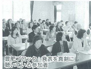
豊肥ブロック：発表を真剣に聴いている参加者