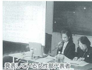
発表している女性部代表者