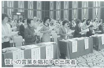
誓いの言葉を唱和する出席者