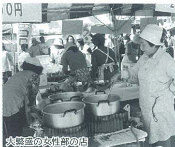
大繁盛の女性部の店

商工会女性部も例年通り「フライドポテト」と「チキンのから揚げ」を作りました。食べ物屋の出店も多く、売上げの方はまあまあと云ったところで、多くの女性部員の参加により、普段忙しきであまり交流することのない部員仲間と楽しいふれあいの時間を持って、有意義な一日を過ごしました。