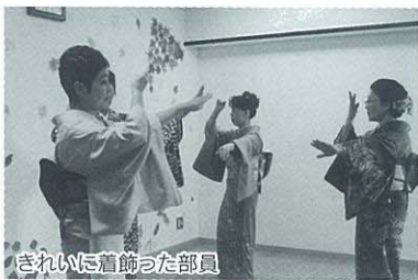
きれいに着飾った部員

慰問当日は衣装にも趣向を凝らした発表に、集まったお年寄りから大きな拍手が送られていました。