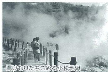
湯けむりたちこめる小松地獄

飯田高原ではオーガニック料理店「wed」でオーナー直伝のこだわりの地元食材について意見交換をしながら、身近な食材がシンプルに素味付けであるのに素敵で、しかも美味しくも美味しに変化させることに、素材の大切さとともに、食の大切さあらためて学びました。