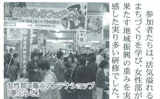
女性部で賑うアンテナショップ「夢プラザ」

また、豊富な観光資源を活用したまちづくりと町内の誘客活動を学びました。また県連が広島市内で運営し、商工会地域の情報センターとしての機能も有しているアンテナショップ「ひろしま夢プラザ」を視察。