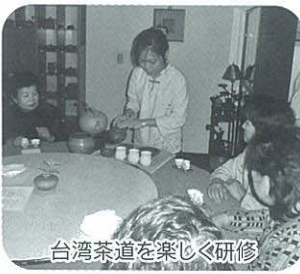
台湾茶道を楽しむ研修

新年明けましておめでとうございます。商工会女性部員の皆様におかれましては、ご家族の皆様とともに、お健やかに新年を迎えられましたことを心よりお慶び申し上げます。また、県女性連事業の運営に對しまして、日頃よりご理解・ご協力を賜り厚く御礼申し上げます。さらに各々での女性部活動にも積極的に取り組んでいただき深く感謝申し上げます。さて、私も商工会を取り巻く環境は大変革期を迎