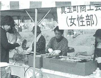
具玉町商工会(女性部)

十一月四日(日)、豊後高田市の三大イベントの一つ「よつちよくれ祭」に「焼鳥商工会女性部」として今年も出店しました。例年に比べて二十日ほど早い開催で、どれくらいの人出か分かりませんが、当日は大盛況で、午後二時には用意した焼鳥一五〇〇本が完売しました。