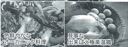
色鮮やかなオーガニック料理