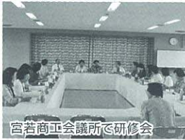
宮若商工会議所研修会

当日は、町内のホテルで玖珠郡内の二十〜四十代の独身男女四十六人の参加があり、〇×クイズや男性が三分毎に移動して女性とトークを楽しむ自己紹介タイム、その後、インプレッションカードに記入後、アドバンスカードを渡してフリートークで大変盛り上がりしました。今後、もう一度開催し、カップル誕生を目指しています。