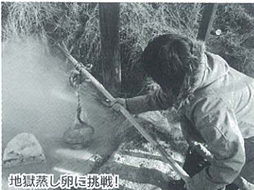
地獄蒸し卵に挑戦!