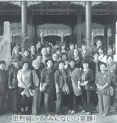
忠烈祠にて みんないい笑顔!

も、これまで大きな組織改革の年です。このような厳しい時代だからこそ、組織の結束力をより一層強め、経営者としての資質向上に努めながら、地域経済発展